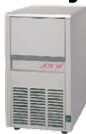
KL 18 Joy